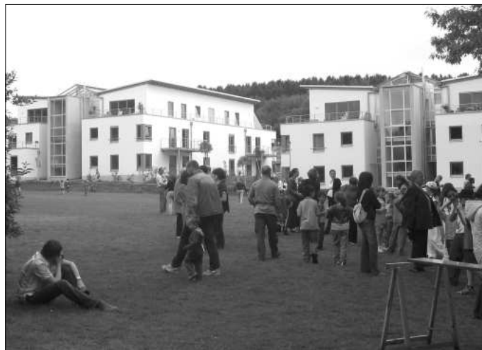
Die Neubauten an der Kirchwiese

Das gemeinsame Engagement der Schulpflegschaft der Katholischen Grundschule und des Bürgervereins Holzlar, die Wiese nahezu in ihren bisherigen Ausmaßen zu erhal-