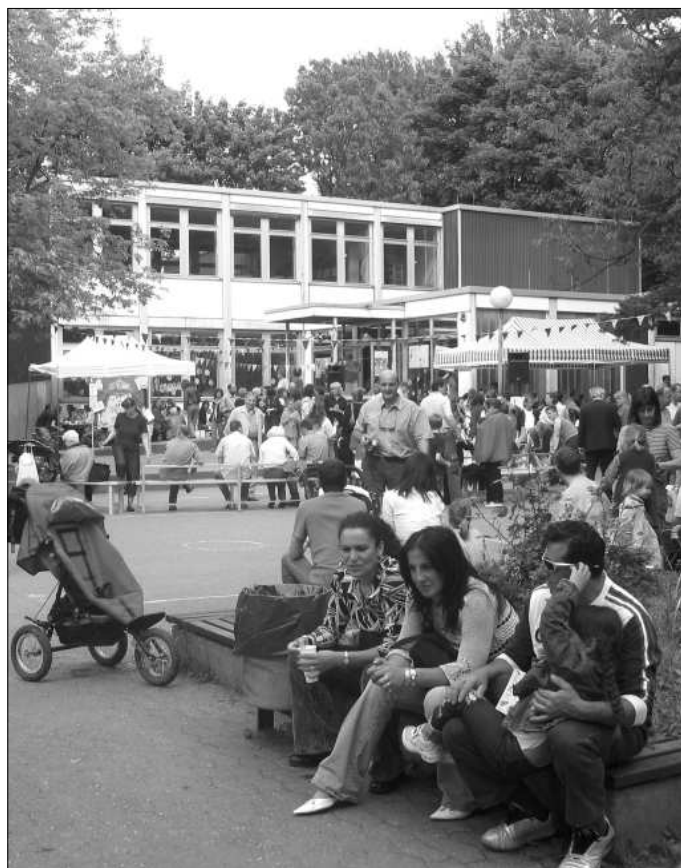
Das Gebäude am Heideweg während des Spielefestes der Schule am 21.5.2005

Sie sehen: Es wird und muss einiges geschehen. Bis alles fertig ist, wird es sicher Herbst, wenn nicht Weihnachten werden. Danach haben wir aber einige Verbesserungen erreicht, die unseren Kindern und der ganzen Schule sehr nützen werden.