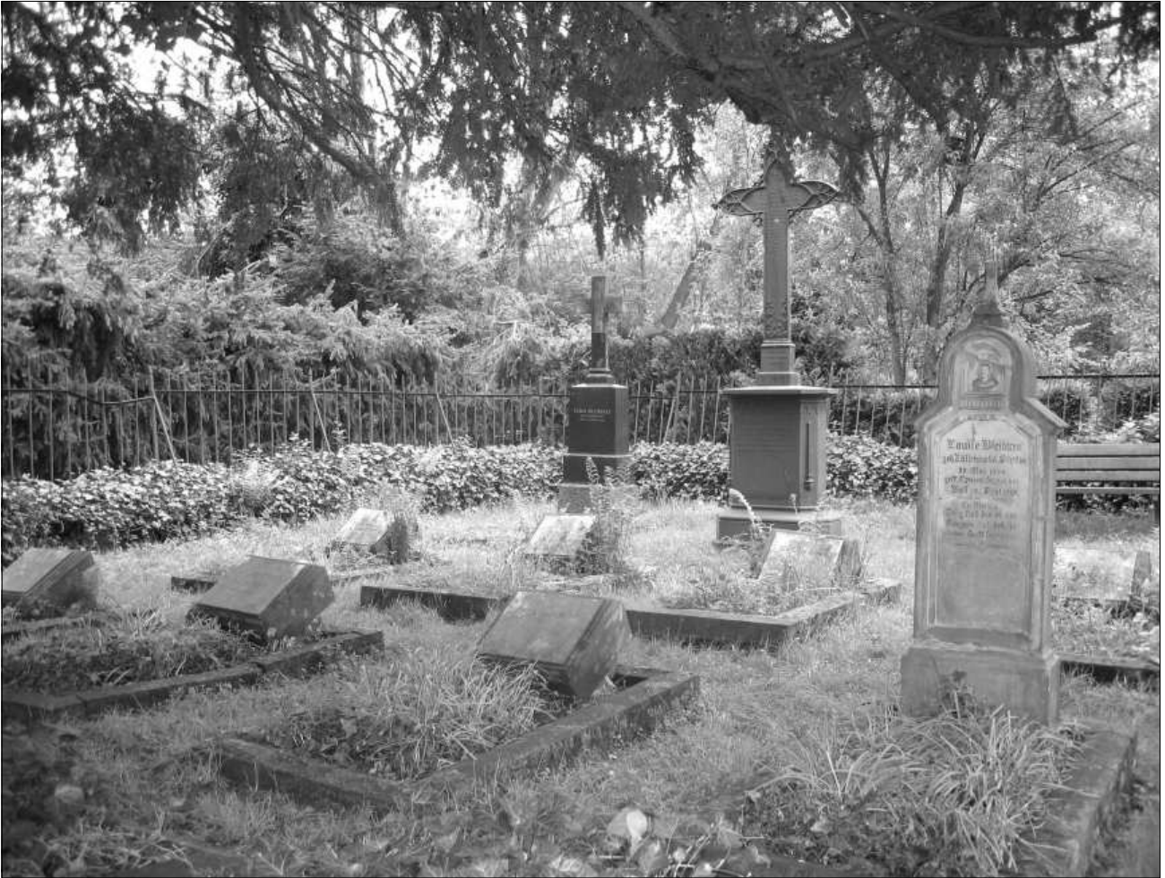
Die Bleibtreuschen Gräber auf dem evangelischen Friedhof in Bonn-Holzlar