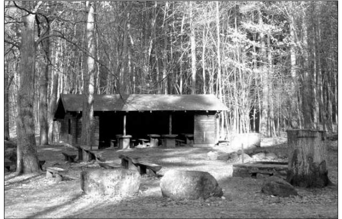
Grillhütte und Grillplatz am Hardtweiher