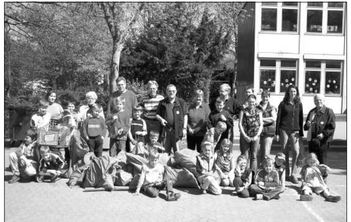
Die Teilnehmer der „Bonn picobello“-Aktion nach getaner Arbeit

In mehreren Gruppen gingen Eltern und Kinder erfolgreich auf Müllsuche. Wieder wurden zahlreiche Säcke mit originellem und weniger originellem Abfall (Zigarettenkippen, Flaschen, Papier, Brettern, Schachteln usw.) gefüllt. Selbst ein unerlaubt entsorgter Einkaufswagen gehörte zum Sammelergebnis.