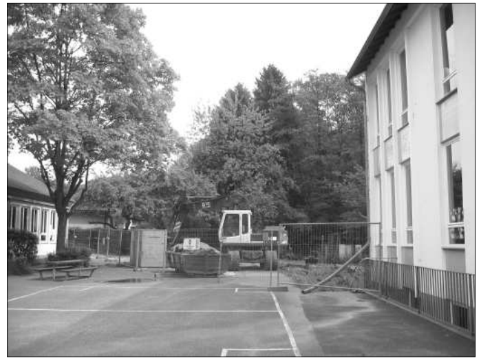
Die Baustelle für die neuen Klassenräume

An der Hauptstraße werden am Waldgebäude drei Klassenräume angebaut und die beiden Räume im Souterrain für den Unterricht renoviert. So können in Zukunft alle Klassen an einem Standort untergebracht werden, was un-