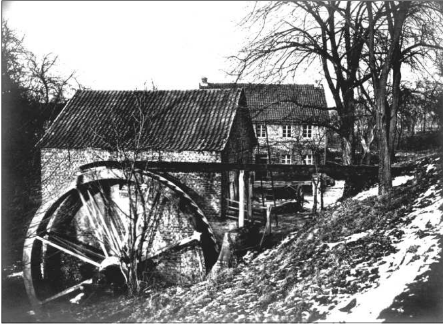
Die Holzlarer Mühle mit dem alten eisernen Wasserrad Das Foto war die Vorlage für die Federzeichnung von H. Wirtgen (siehe Seite 7 oben).