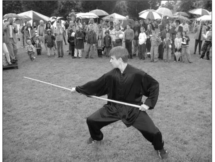
Konzentration und Körperbeherrschung faszinieren die Zuschauer bei dieser Darbietung.

Noch heute, ich habe nachgefragt, reden die älteren Holtorfer vom Roleber Bach und die Roleberer vom Holtorfer Bach - eine unbewußt großzügige Grenzbenennung, lange unerkannt durch behinderte Kommunikation.