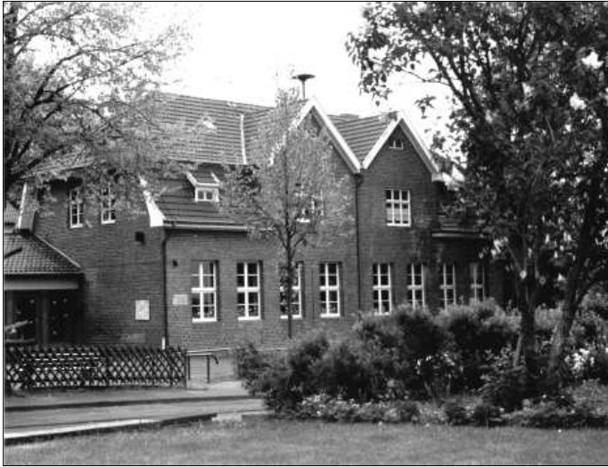
Katholische Grundschule Holzlar, Hauptstraße 105