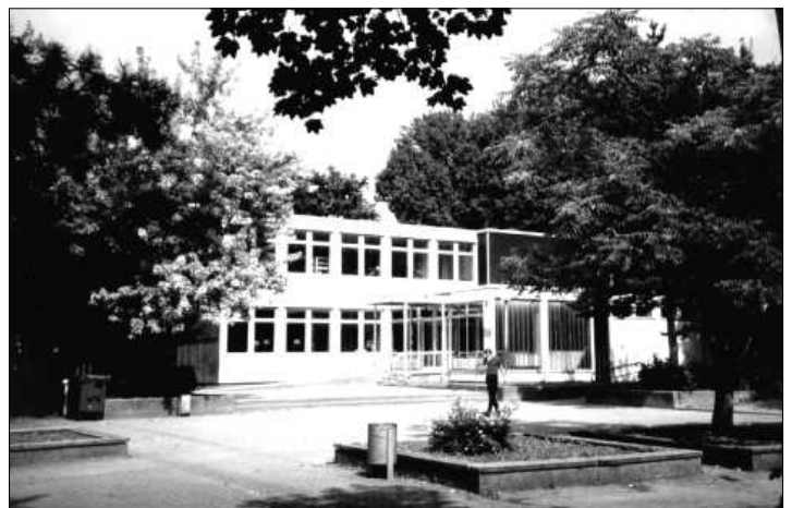
Katholische Grundschule Holzlar, Abteilung Heideweg

Dies alles kann und wird uns aber nicht daran hindern, an der Weiterentwicklung unserer Schule zum Wohle unserer Kinder zu arbeiten. Pläne, Konferenzen, Tests und Analysen sollten uns ein Wort von Bruno Bettelheim nicht vergessen lassen: Die Erziehung der Kinder ist eine kreative Aufgabe, eher eine Kunst als eine Wissenschaft.