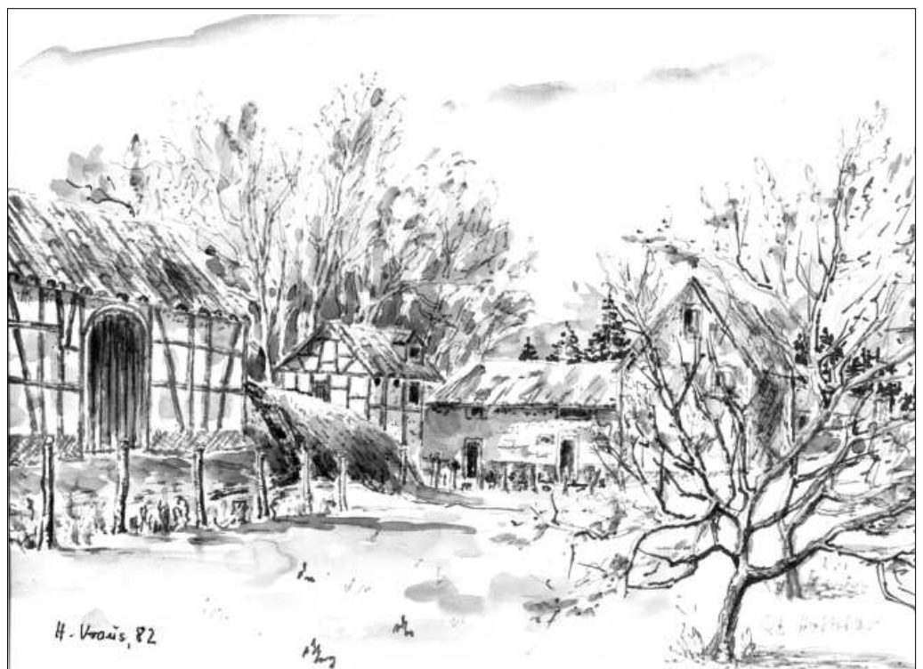
Das Mühlenanwesen vor der Bebauung Lavierte Federzeichnung von Hilde Kraus aus dem Jahre 1982