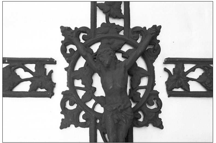
Detailaufnahme mit den Bruchstücken des Kreuzquerbalkens

Nach Erstellen der Schweißnähte haben wir sämtliche Nähte einer Farbeindringprüfung unterzogen. Bei diesem Verfahren wird durch Aufsprühen einer speziellen, extrem kriechfähigen Farbe und eines Entwicklers selbst der kleinste