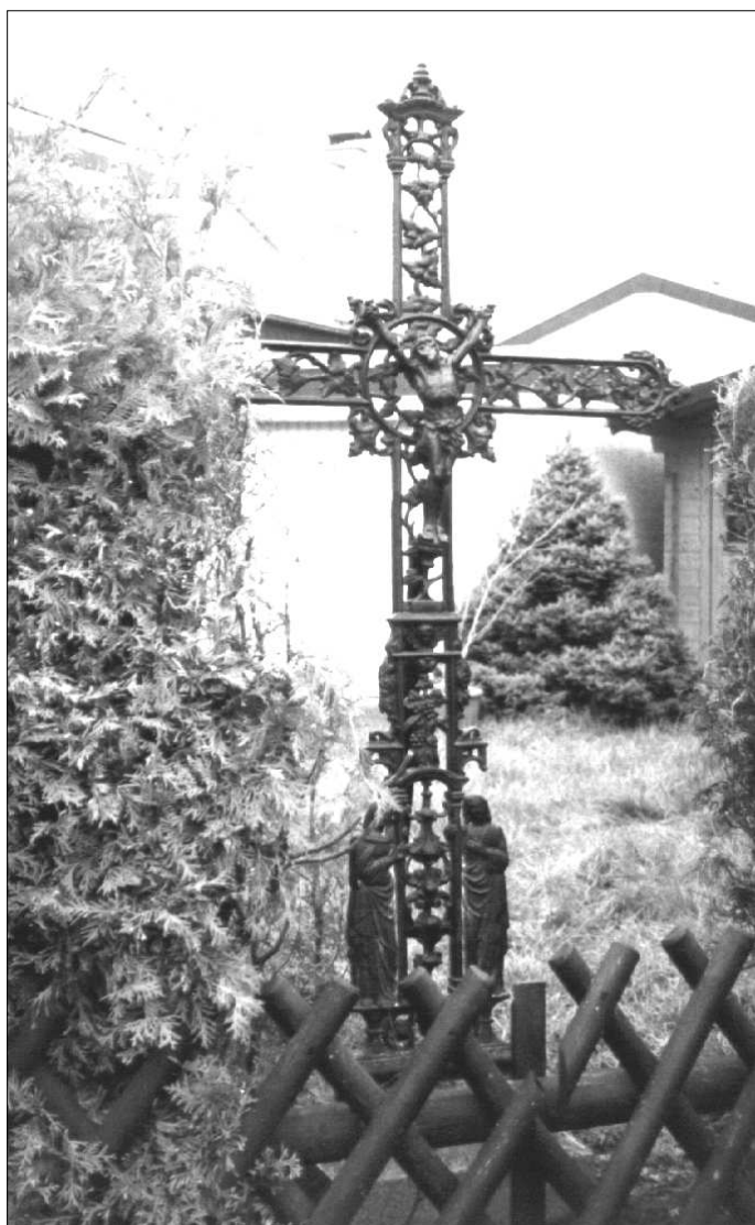
Das restaurierte gußeiserne Kreuz an der Ecke Roleberstraße/Ettenhausener Straße